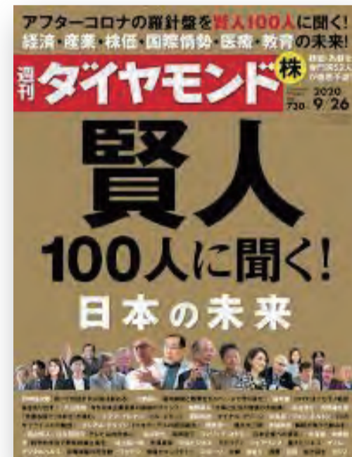
週刊ダイヤモンド 『賢人100人に聞く日本の未来』 ダイヤモンド社 (2020/9)