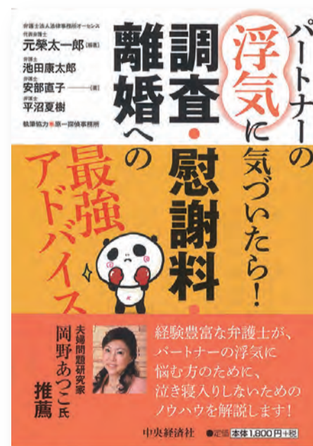
※岡野の推薦図書 弁護士・池田康太郎 著 『調査・慰謝料・離婚への最強アドバイス』 中央経済社 (2014/5)