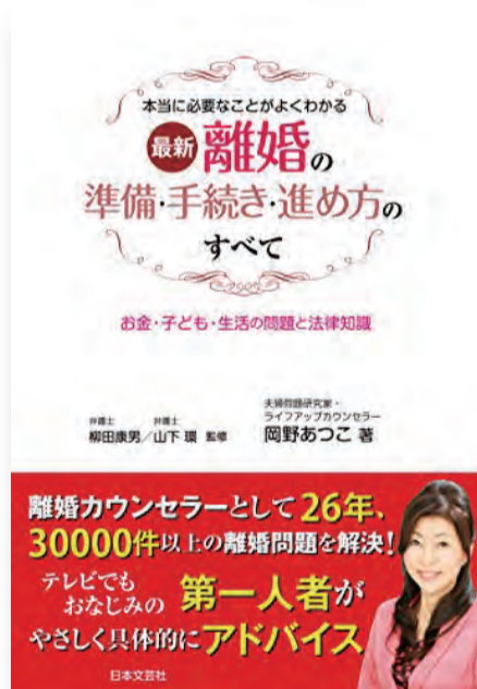
岡野あつこ著 『離婚の準備・手続き・進め方のすべて』 日本文芸社 (2016/12)